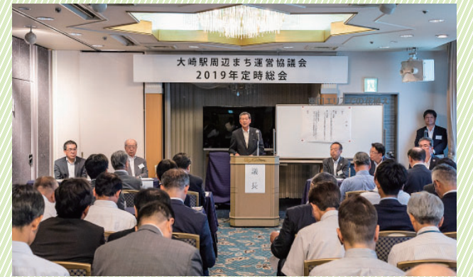
2019 年度定時総会 (於：ニューオータニイン東京)

2019年7月22日に「大崎駅周辺まち運営協議会2019年定時総会」が開催され、2018年度活動報告及び決算書、2019年度活動計画及び予算書が承認されました。