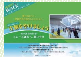
夢さん橋ハーティーウォーク