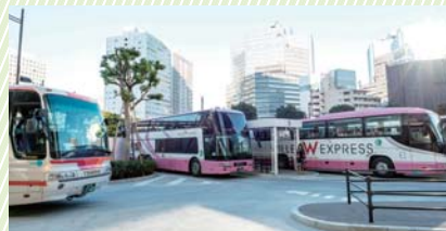
H.28.10月からは成田国際空港・芝山町を結ぶ成田便が運行予定

H.27.12.7に大崎駅西口バスターミナル開業 既存の地域バス路線(東急バス渋41系統の一部)に加え大阪、名古屋、新潟、仙台、富山・金沢、長野、秋田の8都市を結ぶ高速路線バスが運行中