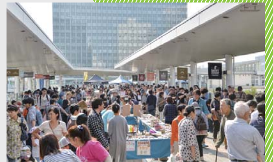
平成27年度は10月10～12日に開催 参加者延べ8万人 東京都試算による経済効果 2.2億円