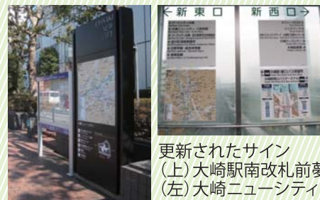
更新されたサイン (上)大崎駅南改札前夢さん橋 (左)大崎ニューシティ