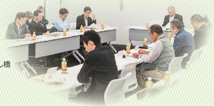
H.27.10.19開催第5回まち運営委員会