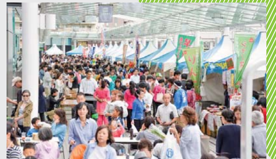
平成28年度は10月8～10日に開催 参加者延べ7万人