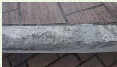
公園ベンチの破損状況