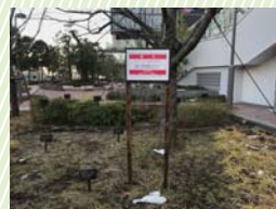
スケートボード使用禁止に関する警告看板