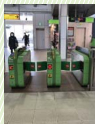
増設された改札機

●大崎西口公園スケートボード禁止看板設置後も、スケートボード使用が見受けられたため、品川区公園課により警告看板を設置したことや、八潮北公園内にスケートボード場が整備されたことを情報共有しました。