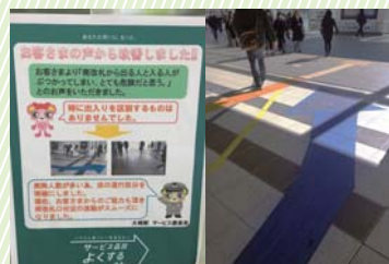
通行区分の明確化