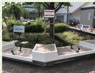
手摺りが設置された大崎西口公園のベンチ