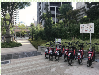
大崎西口公園および小関橋公園に設置されたシェアサイクルポート