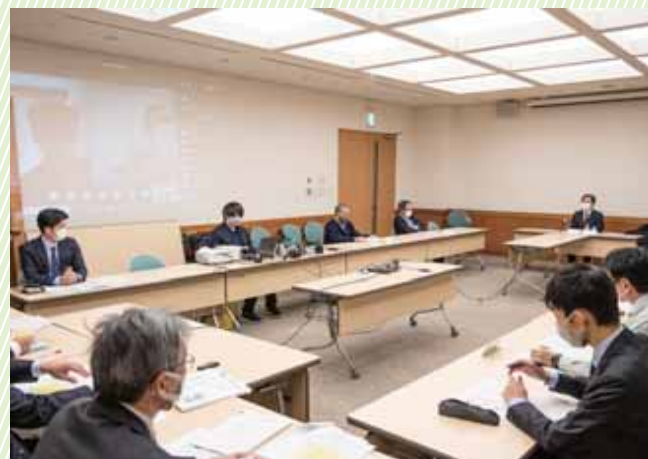
会場はソーシャルディスタンスを確保。写真左手の壁にオンライン画面を投影。中央にあるのは会場の声を拾う収音マイクと調整機器。

本委員会では初となる、オンラインシステムの活用と会場をあわせた会議となり、感染症対策に十分に配慮しながら、オンラインでの参加者を含めて通常通りの議事進行を実施しました。