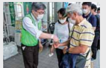
来場者への検温等も実施