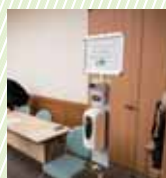
会場入口で検温・手指の消毒を実施。