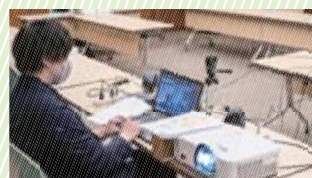
オンライン参加の方の音声や会場カメラの調整はここで行っています。