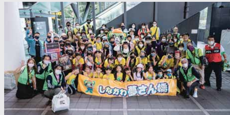
参加頂いたボランティアスタッフの皆さん(マスク、マウスガード等を着用の上速やかに黙って撮影しました)

規模は縮小しながらの開催でしたが、人気の青空バザールや、元気なかけ声が広がる小学生サッカー大会、さらに「ノンストップ山手線 夢さん橋号」など、多くの人に楽しんでいただくことができました。