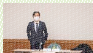
2020年度より着任された長谷川委員長にご挨拶いただきました。

大崎周辺地域の開発状況やコロナ禍を受け、「大崎が今後どのようなまちを目指していくか」といったテーマも提示されるなど、大崎駅周辺まち運営委員会の役割や可能性についても検討される、意義深い委員会となりました。 今後とも様々な方法を活用し、広く委員の皆様のご意見を伺いながら、活発な委員会活動を持続するため事務局一同励んでまいります。皆様ご協力のほど何卒よろしくお願い申し上げます。