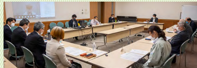
2021年定時総会議案書(案)の内容を確認した第28回まち運営委員会の様子