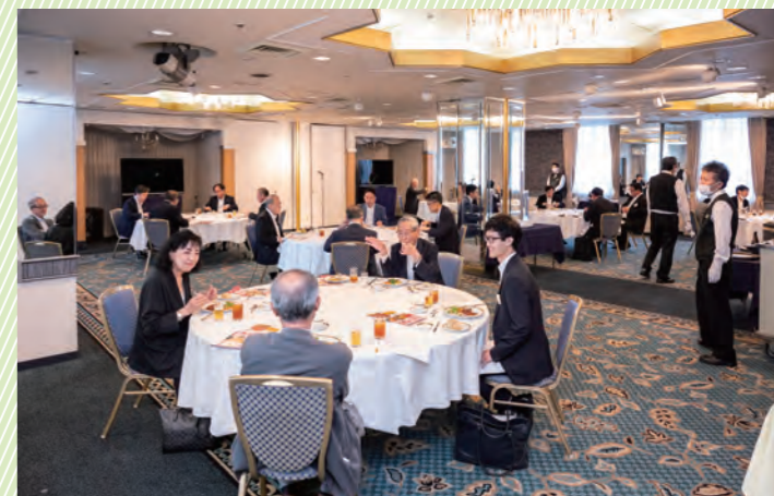
懇親会 (於: ニューオータニイン東京)