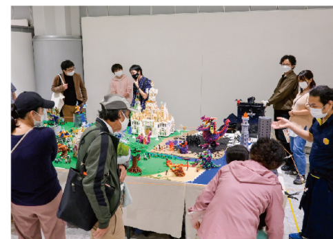
O美術館「夢さん橋特別展」