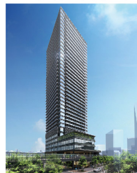
大崎駅西口F南地区 のイメージ