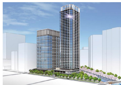
東五反田二丁目第3地区のイメージ（2023年2月時点）