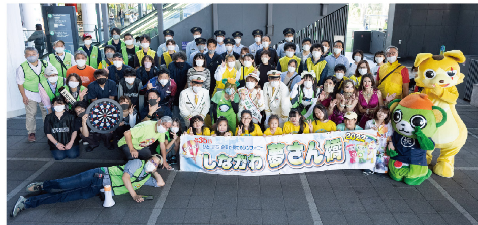
参加頂いたボランティアスタッフの皆さん

2022年10月8日～10日、「第35回しながわ夢さん橋2022」は3年ぶりの通常開催となりました。また、プレイベントである「パワードリームミュージックフェスタ」も10月2日に一部縮小したものの、こちらも3年ぶりの開催となりました。