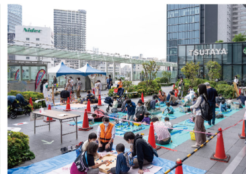
子どもたちの遊び場「ファミリーゾーン」