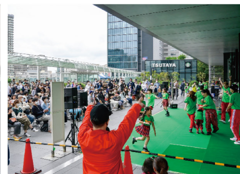
地域の皆さんの発表の場「夢さん橋ステージ」