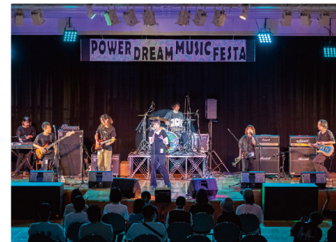
プレイベント「パワードリームミュージックフェスタ」