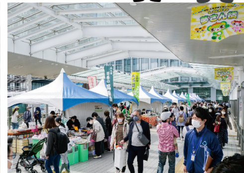
沢山のブースが出店「青空バザール」