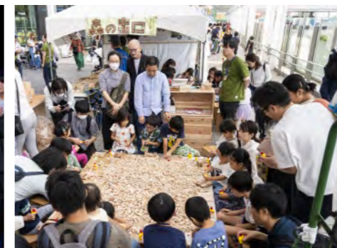
お子様が楽しめるコーナーも充実