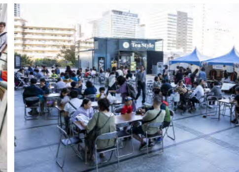
美味しい物が盛沢山