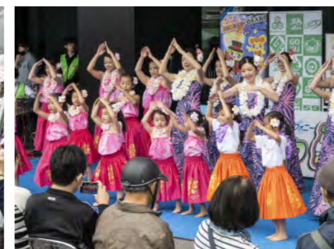
地域で活動される皆さんが多数出演したステージ