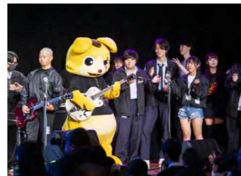
バンドコンテスト「パワードリームミュージックフェスタ」の開催