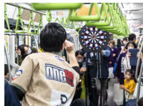
貸切った山手線の中でダーツパフォーマンス