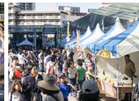
3日間でのべ200団体が出店