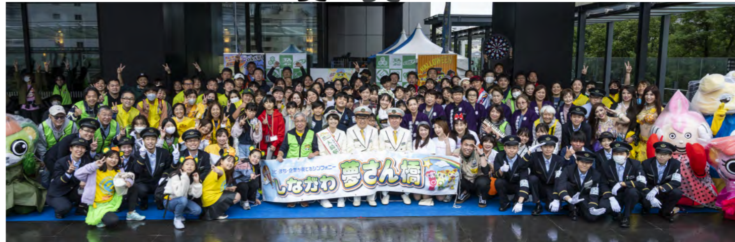
参加頂いたボランティアスタッフの皆さん